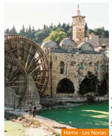
Hama - Les Norias

Arrivée et retour dans votre région si transfert souscrit.