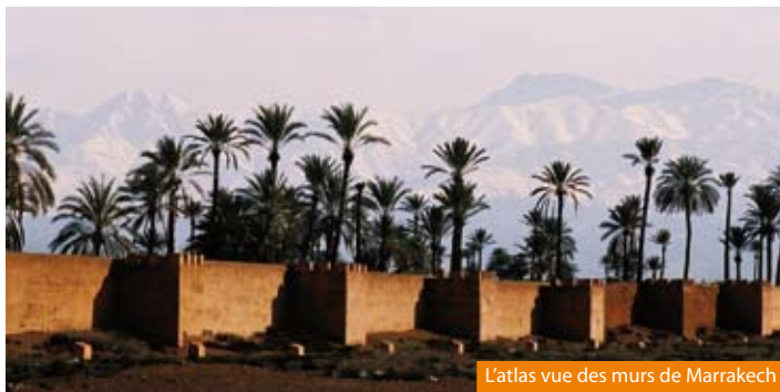
L'Atlas vue des murs de Marrakech

NOS PRIX COMPRENNENT : Le transfert aéroport si souscrit - Le transport aérien aller-retour sur vols réguliers ou spéciaux - Les taxes aériennes (132 € à ce jour) - Le transport en autocar ou minibus pendant le circuit - L'hébergement en chambre double sur la base d'hôtels 3/4* (normes locales) - La pension complète du dîner du 1 er jour (dans l'avion ou à l'hôtel) au petit-déjeuner du 8 e jour - Les services d'un guide accompagnateur francophone et de guides locaux - Les visites et excursions mentionnées au programme - L'assistance rapatriement