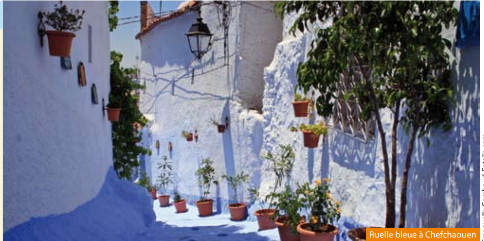
Ruelle bleue à Chefchaouen