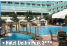
• Hôtel Delfin Park 3***