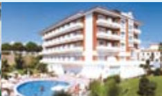
• Hôtel Gran Garbi Mar 3***