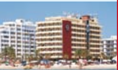
• Hôtel Victoria & Spa Elit 3*** sup.