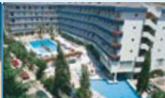
• Hôtel Aquarium 4****