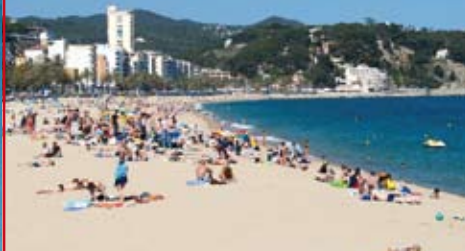
Lloret de Mar