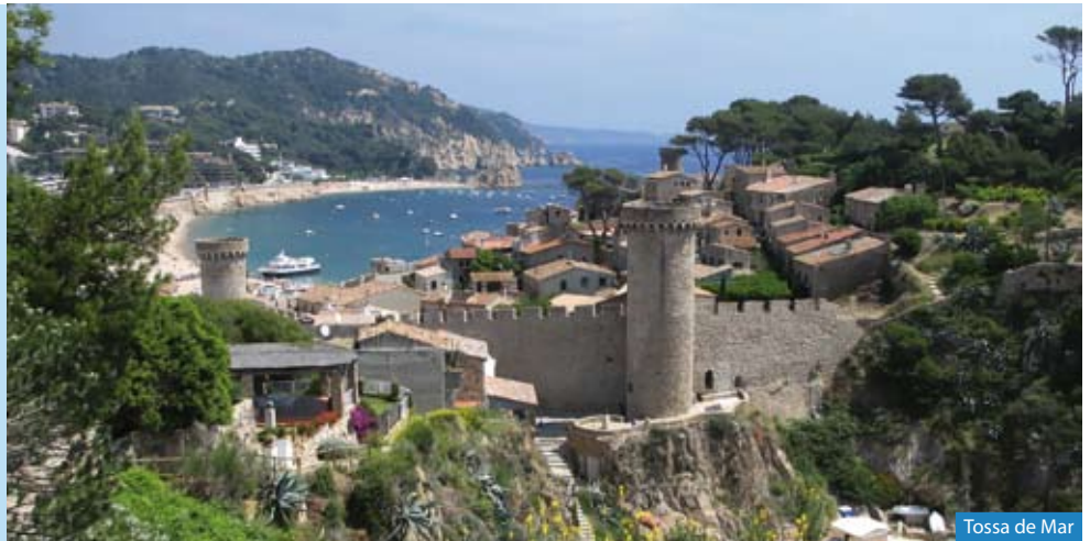
Tossa de Mar