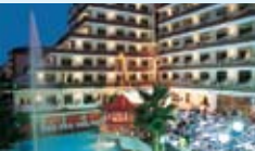
• Hôtel Indalo Park 3***