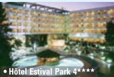
• Hôtel Estival Park 4****