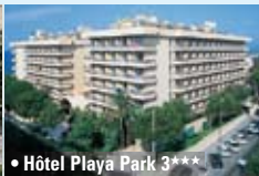
• Hôtel Playa Park 3***