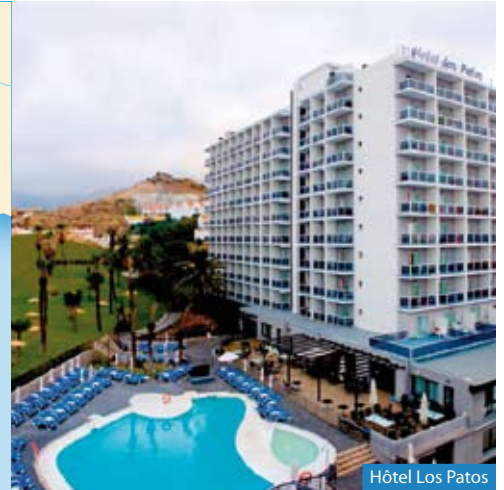
Hôtel Los Patos