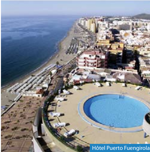
Hôtel Puerto Fuengirola