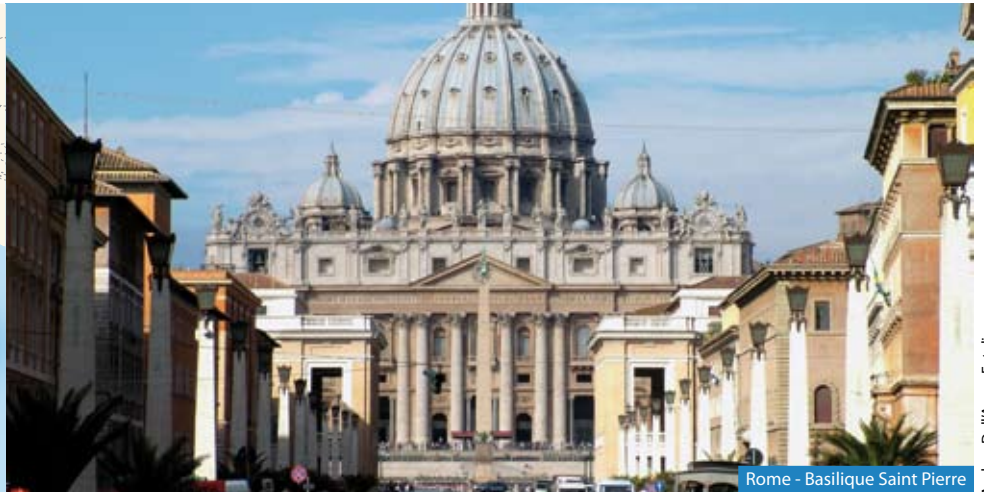
Rome - Basilique Saint Pierre