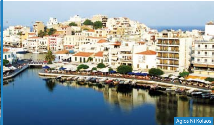
Agios Ni Kolaos