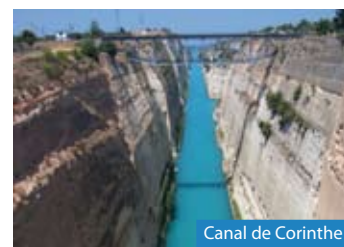
Canal de Corinthe

ransfert vers le port de Poros . Trajet en hydroglisseur pour Le Pirée . Tour panoramique du Pirée. ✕ poisson au port de Microlimano. Départ pour Delphes . Arrêt au monastère d' Ossios Loukas . ✕ et ✕.