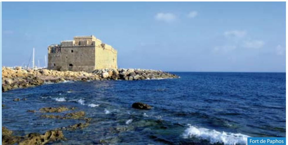
Fort de Paphos