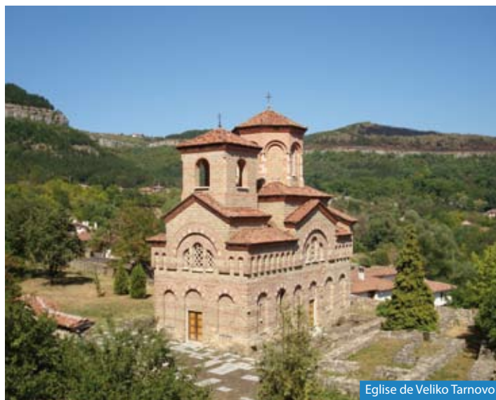
Eglise de Veliko Tarnovo

Transfert à l'aéroport de Varna . Vol vers la France . Retour dans votre région si transfert souscrit.