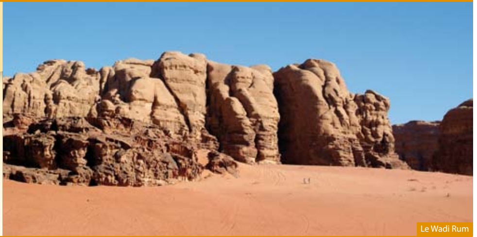
Le Wadi Rum