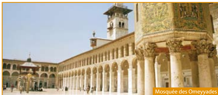
Mosquée des Omeyyades

Arrivée et retour dans votre région si transfert souscrit.