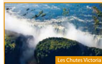
Les Chutes Victoria

J14 : FRANCE Petit-déjeuner à bord. Arrivée en France. Retour dans votre région si transfert souscrit.