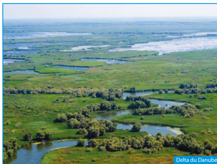
Delta du Danube

Selon l'horaire de vol, continuation de la visite de Bucarest avec la visite du Palais du Parlement. Puis départ vers l'aéroport de Bucarest. Vol pour la France . Arrivée, retour dans votre région si transfert souscrit.