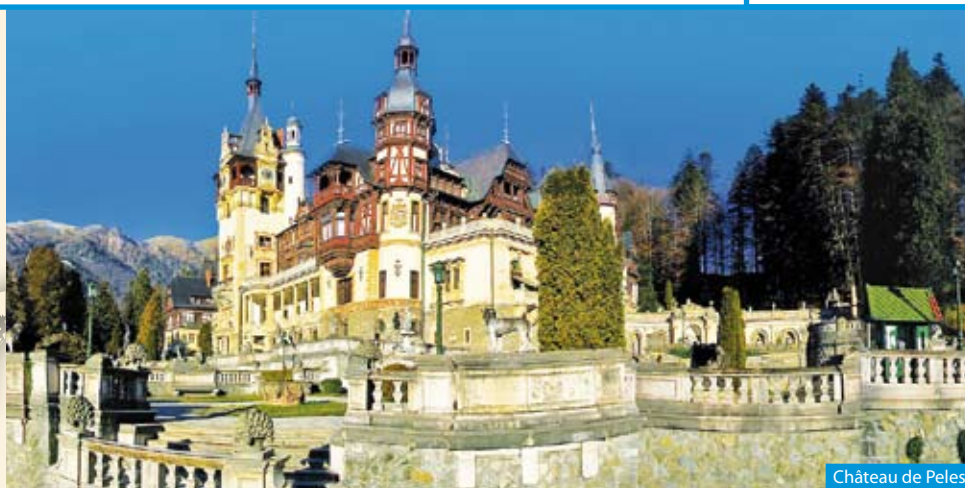
Château de Peles