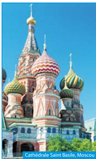
Cathédrale Saint-Basile, Moscou

Départ de votre région si transfert souscrit, sinon rendez-vous à l'aéroport. Vol pour Saint-Pétersbourg . Accueil et transfert à l'hôtel. ✈